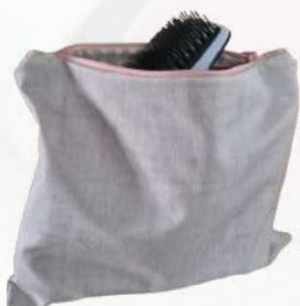
ESTER PUJOL NECESSER

Quan cosim, no només unim teles: també compartim temps, converses i complicitats.